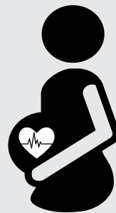
Antecedentes de preeclampsia History of preeclampsia