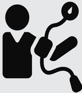
Hipertensión arterial High blood pressure

Ask about aspirin if you have any of these risk factors: