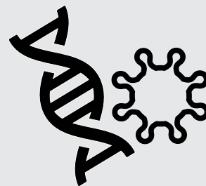
Trastornos autoinmunes Autoimmune disorders