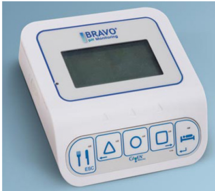
All rights reserved. Image used with permission from Medtronic.