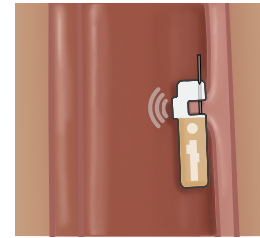
مسجل برافو Bravo recorder