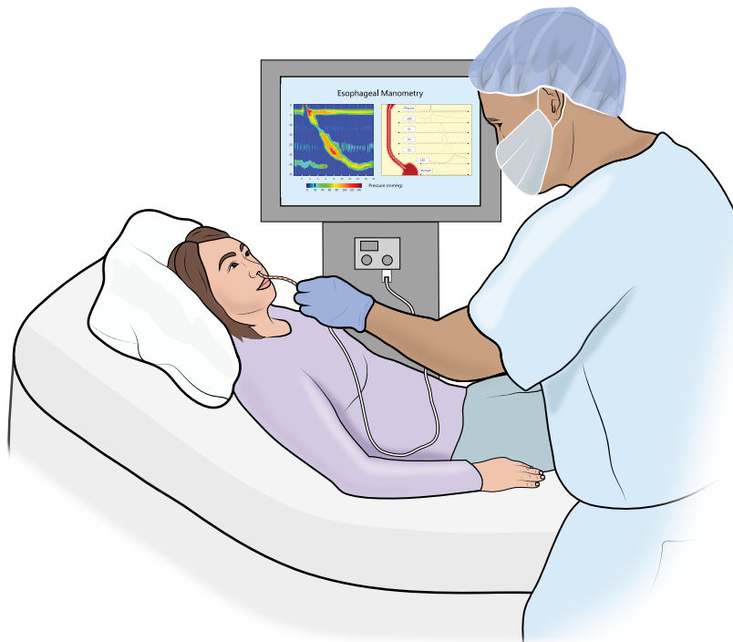
Figura 1: el catéter se introduce en la nariz. La computadora registra la presión del esfínter esofágico inferior.

Figure 1: The catheter is inserted into the nose. The computer records the pressure of the lower esophageal sphincter.